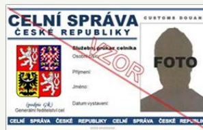
vzor služebního průkazu příslušníka Celní správy ČR